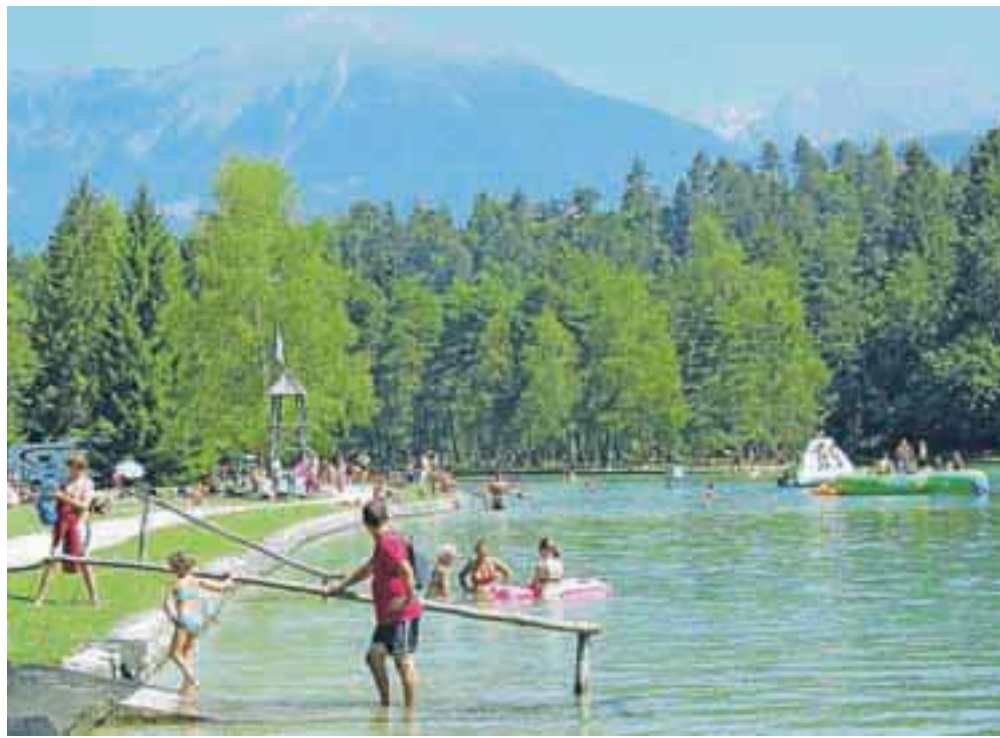
Voda v Šobčevem bajerju je bila letos sicer nekaj hladnejša kot prejšnja leta, a to ni zmotilo številnih obiskovalcev, ki so v vročih poletnih dneh iskali predvsem osvežitev.

Posebnost letošnje sezone, sploh v primerjavi z lansko, je tudi relativno hladna voda v bajerju. Temperatura se namreč niti v najbolj vročih dneh ni povzpela na več kot 21 stopinj Celzija, medtem ko se je voda lani segrela tudi do 26 stopinj Celzija. »Razlog za to je visoka podtalnica. Čez zimo je bilo veliko snežnih padavin, zato imamo še zdaj reden dotok sveže mrzle vode v jezero. Seveda bi jo lahko odvajali in na ta način zvišali temperaturo kopalne vode, a bi se posledično poslabšala kvaliteta, saj topla voda omogoča hitrejšo rast alg,« še pojasnjuje Gašperin.