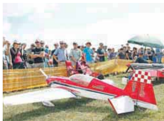
Številni gledalci so si lahko ogledali pestro paleto zanimivih malih letal.

Številni gledalci so si lahko ogledali pestro paleto zanimivih malih letal in njihove drzne vragolije v zraku, že v začetku pa celo prvo strmoglavljenje: letalu hrvaškega tekmovalca je namreč odpovedala elektronika in pregrešno drag model – cene večine od sodelujočih letal so primerljive s cenami manjših avtomobilov – je treščil v pristajalno stezo ter končal kot razbitina. Sicer so mala letala, pomanjšane replike pravih letal, večinoma vzletala, pristajala in letela tako, kot je slikovito opisoval napovedovalec: lepo, mehko in natančno.