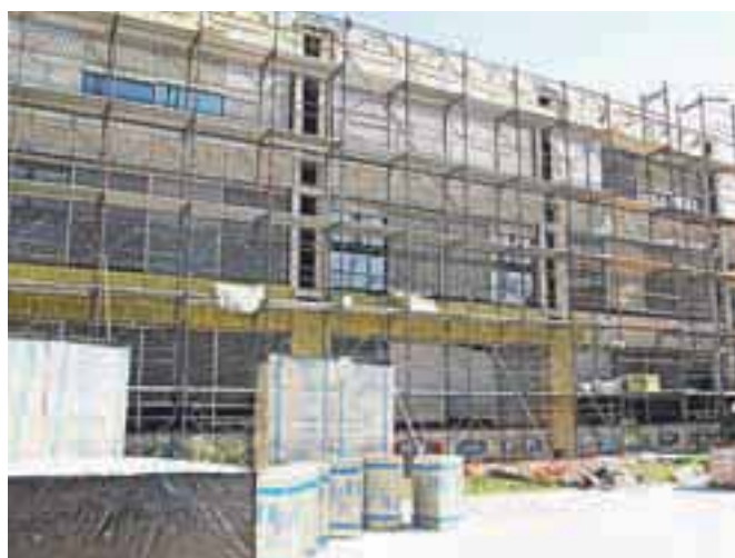
V Radovljici nadaljujejo energetska sanacijo šolske stavbe.