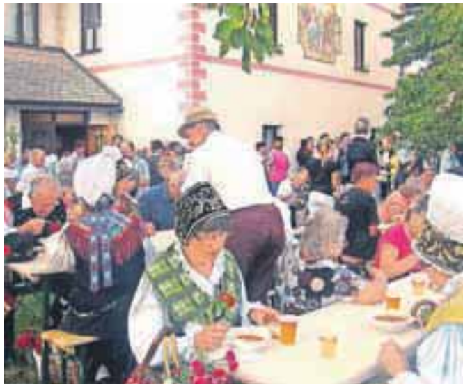
Srečanje faranov in romarjev na župnijskem vrtu