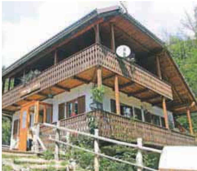
Sankaška koč je bila v zadnjih letih deležna temeljite prenove.