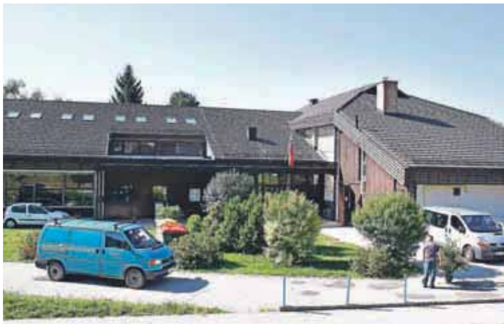
Na podružnični šoli v Begunjah so zamenjali streho.

za infrastrukturo v obdobju do leta 2015 iz kohezijskega sklada prejela 2,1 milijona evrov oz. 85 odstotkov upravičenih stroškov investicij.