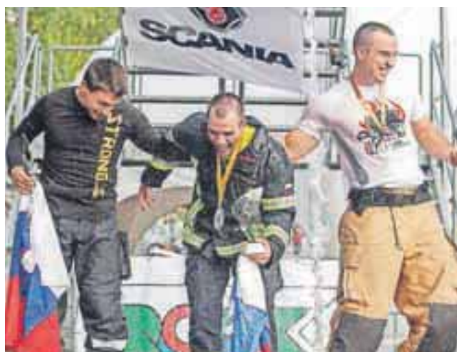
Veseli ob uspehih