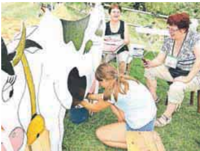
Že lani je prireditev pritegnila številne udeležence.

Glavni namen je predvsem druženje, zato lahko sodelujejo vsi, tako stari kot mladi, družine, posamezniki in pari. Na poti se udeleženci srečajo z zanimivi nalogami, za katere je potrebno nekaj spretnosti, iznajdljivosti, sodelovanja in izvirnosti. Organizatorji še sporočajo, da bo start v centru Begunj pred TIC-em, zaključek pa v Krpinu, prijave in informacije pa so možne na info@begunje.si ali prek facebooka: TD Begunje. Prijavnina znaša 10 evrov, za družine pa 24 evrov. Vsi prijavljeni bodo poleg spominske nagrade prejeli tudi malico. V primeru slabega vremena bo prireditev prestavljena. P. K.