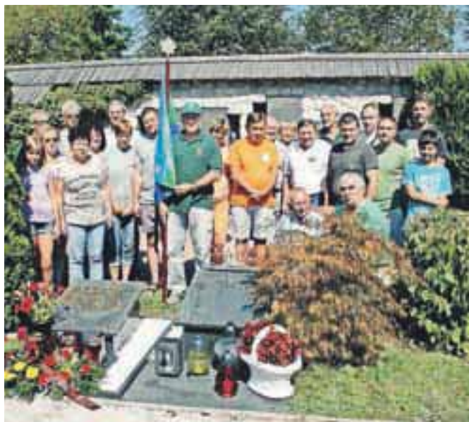
Pohodniki z Nanosa so obiskali radovljiške prijatelje.

neza Smoleta. Goste so nato odpeljali do Lovske kočice na Taležu, kjer so uživali ob čudovitem vremenu in razgledih po Karavankah in Julijskih Alpah in Bledu. »Ker brez petja na naših družbenjih ne gre, smo tu zapeli pesem Poklon domovini, ki smo jo skupaj spesnili na