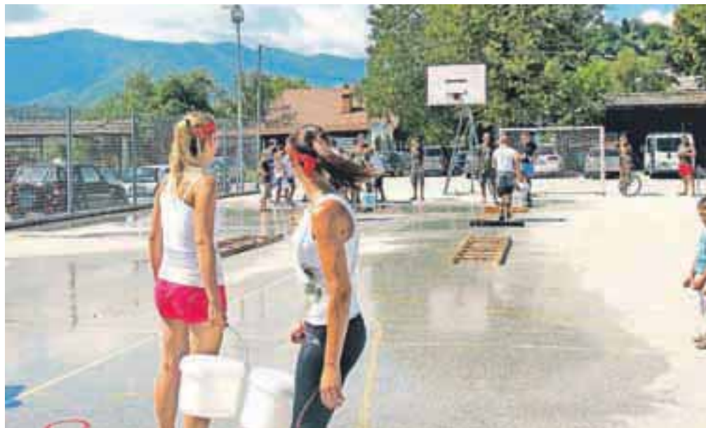
Z Dnevom športa in zabave v Ljubnem je Mladinska skupina Ljubno začela aktivnosti ob krajevnem prazniku. Zaključili so ga z Vaškimi igrami, ki jih je organiziralo domače športno društvo.