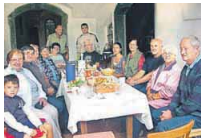
Slikali so stare domačije, grad Kamen, pa tudi tihožitja.