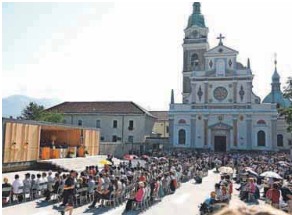
Na veliki šmaren je romalo na Brezje blizu štiri tisoč ljudi.