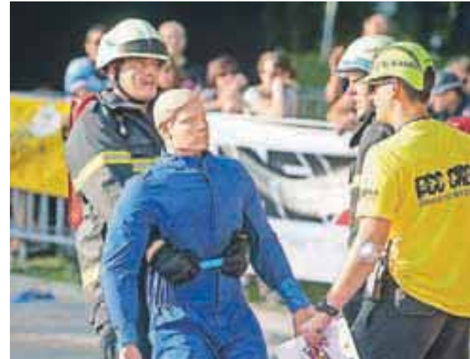
Najtežji dve minuti v športu