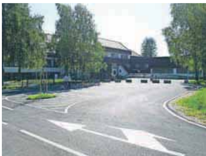
V Lescah so uredili parkirišče in dovoz do šole.